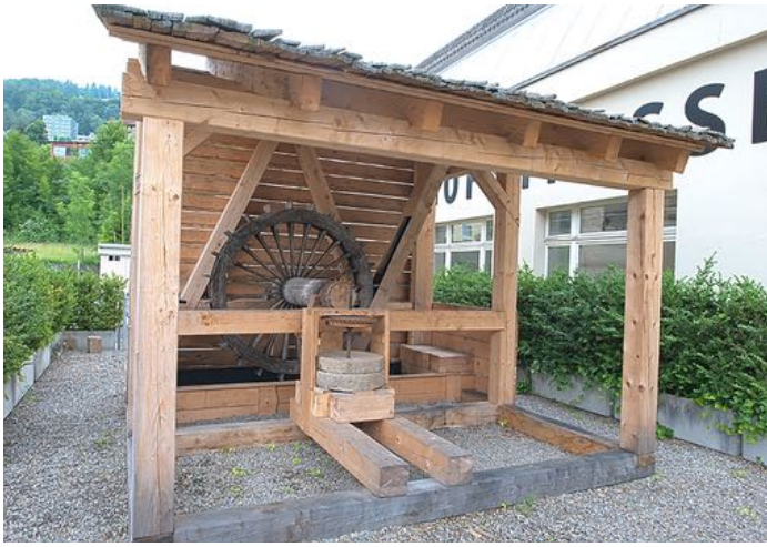
Nachbau der römischen Mühle aus Cham ZG, Hagendorn, Standort Museum für Urgeschichte, Zug (Anlage 91, 16. Schweizer Mühltage)