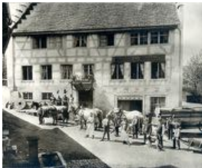
Unterühle Flaach (Anlage 108, 16. Schweizer Mühlentag)