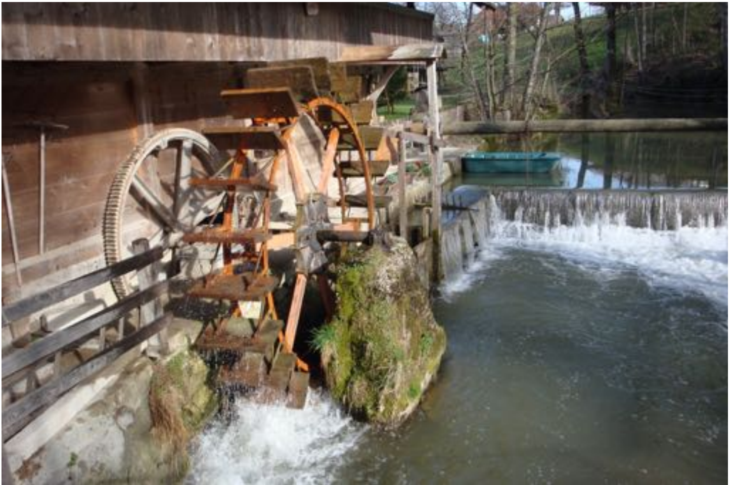
Bleiche Rohrbach (Anlage 11, 16. Schweizer Mühlentag)