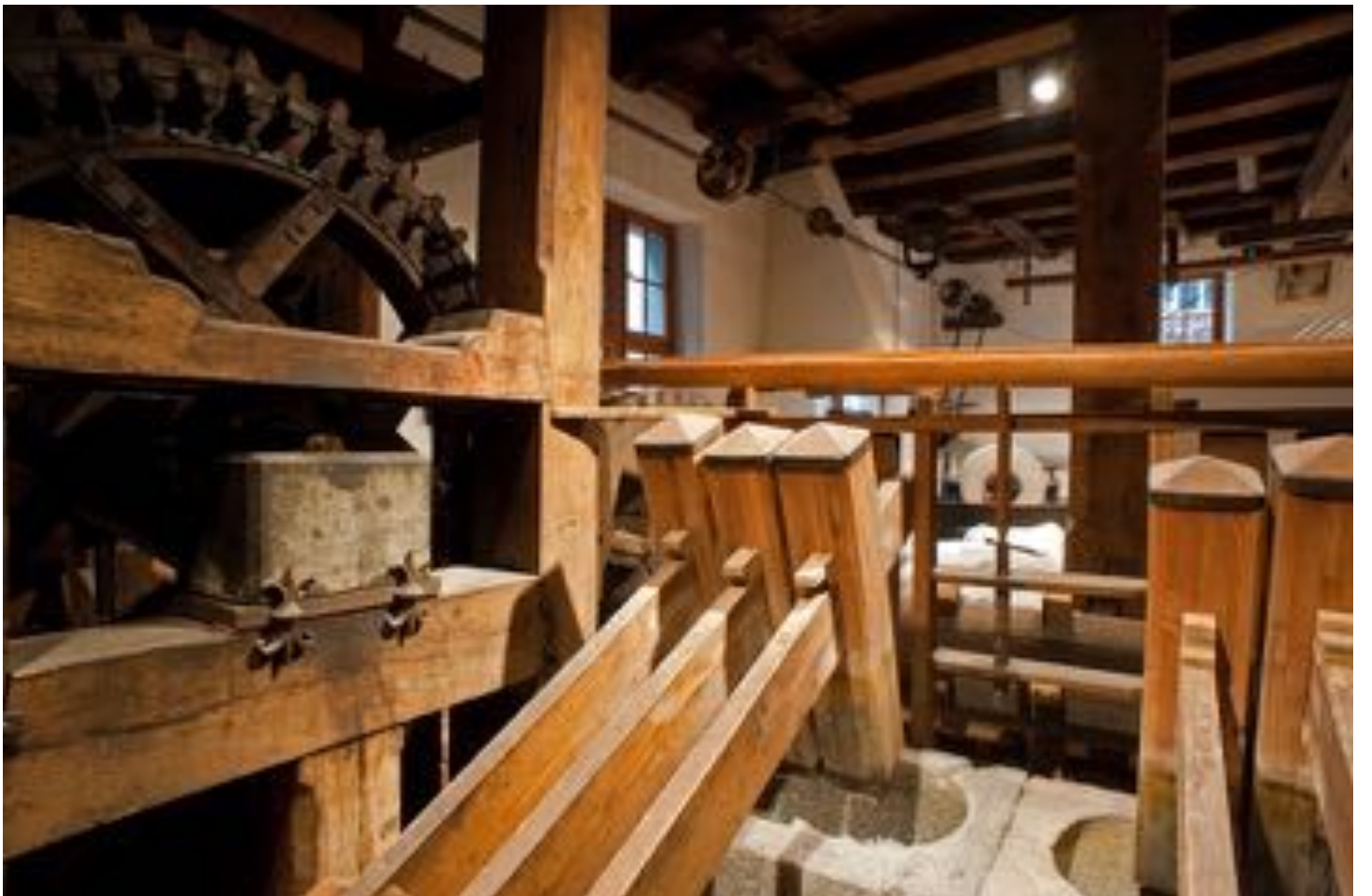
Stampfwerk Papierwerk, Basler Papiermühle, Roland Schmid (Anlage 33, 16. Schweizer Mühltage)