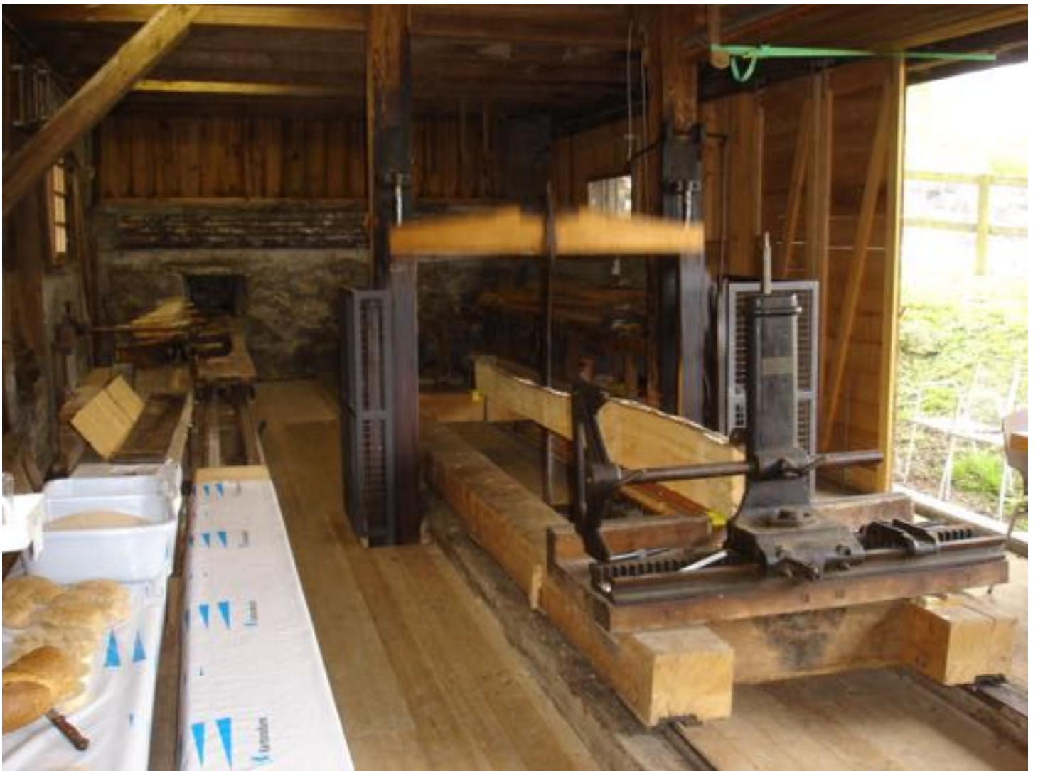
Säge und Mühle Thalwil (Anlage 93, 16. Schweizer Mühltage)