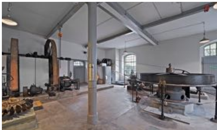
Kleinkraftwerk Ottenbach (Anlage 100, Teilnahme am 16. Schweizer Mühlentag)

Präsident der Vereinigung Schweizer Mühlenfreunde VSM/ASAM