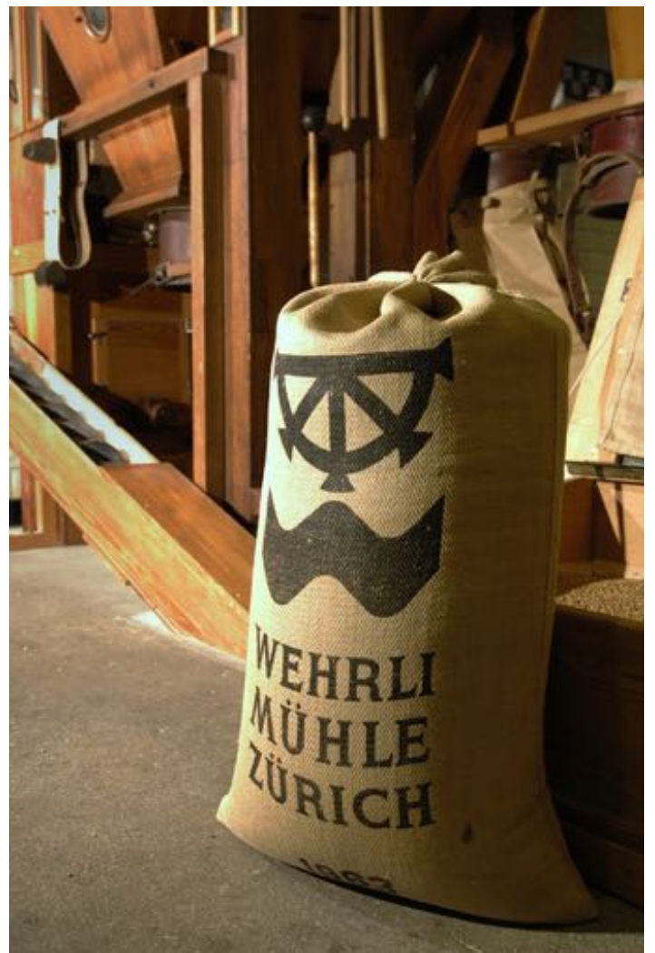
Möhlerama, Tiefenbrunnen Zürich (Anlage 103, 16. Schweizer Mühlentag)

Vorstandsmitglied VSM/ASAM mit Resort Medien&PR, IT c.hagmann@muehlenfreunde.ch