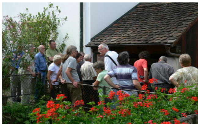
Brüglinger Mühle in Münchenstein.